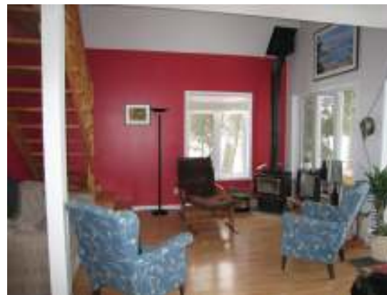
Le salon avec vue sur le fleuve !