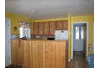
La cuisine !