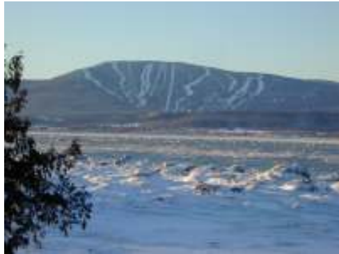
Le Mont St-Anne !